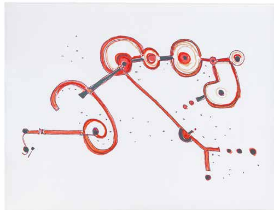
Senza titolo, 1991 Pannello fonoassorbente Snowsound, parete / soffitto, 119 x 159 cm

Untitled, 1937-2017 Sound-absorbing Snowsound panel, wall / ceiling, 119 x 159 cm