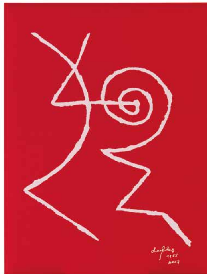
Senza titolo, 1955-2017 Pannello fonoassorbente Snowsound, parete, 159 x 119 cm

Untitled, 1955-2017 Sound-absorbing Snowsound panel, wall, 159 x 119 cm