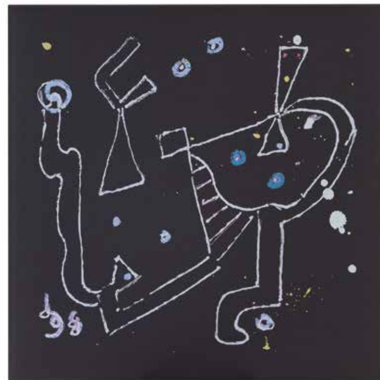
Senza titolo, 1998 Pannello fonoassorbente Snowsound, parete / soffitto, 119 x 119 cm

Untitled, 1998 Sound-absorbing Snowsound panel, wall / ceiling, 119 x 119 cm