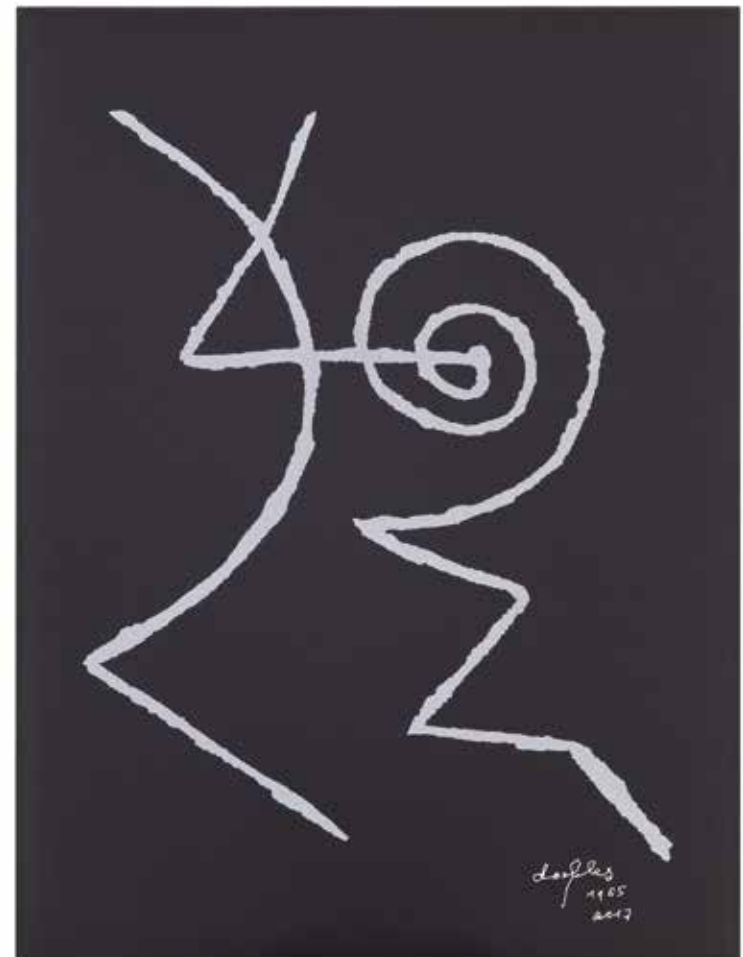
Senza titolo, 1955-2017 Pannello fonoassorbente Snowsound, parete, 159 x 119 cm

Untitled, 1955-2017 Sound-absorbing Snowsound panel, wall, 159 x 119 cm