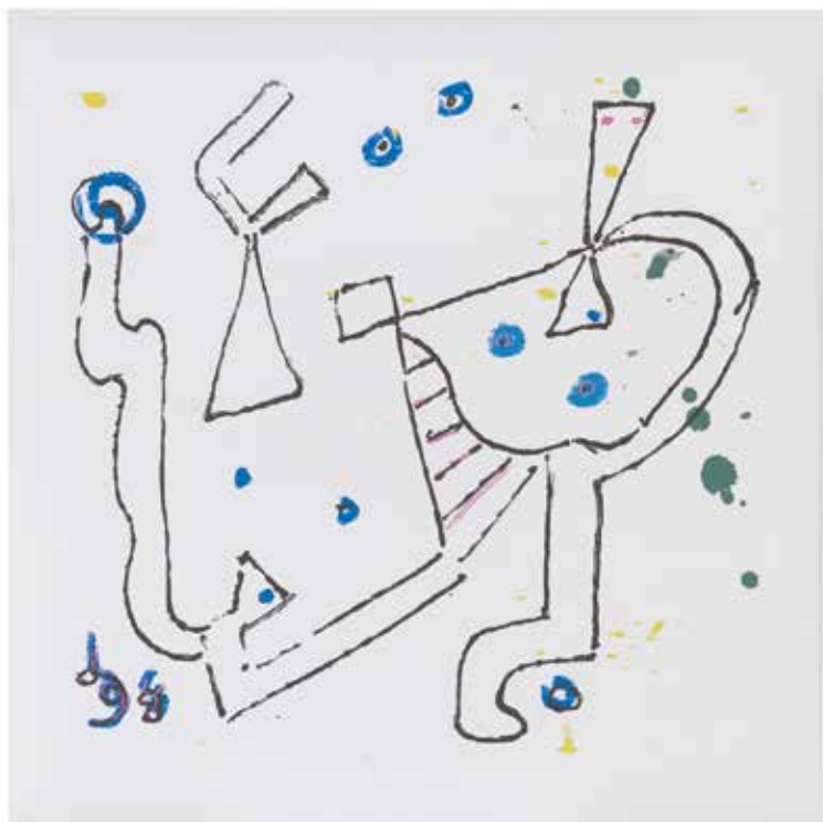
Senza titolo, 1998 Pannello fonoassorbente Snowsound, parete / soffitto, 119 x 119 cm

Untitled, 1998 Sound-absorbing Snowsound panel, wall / ceiling, 119 x 119 cm