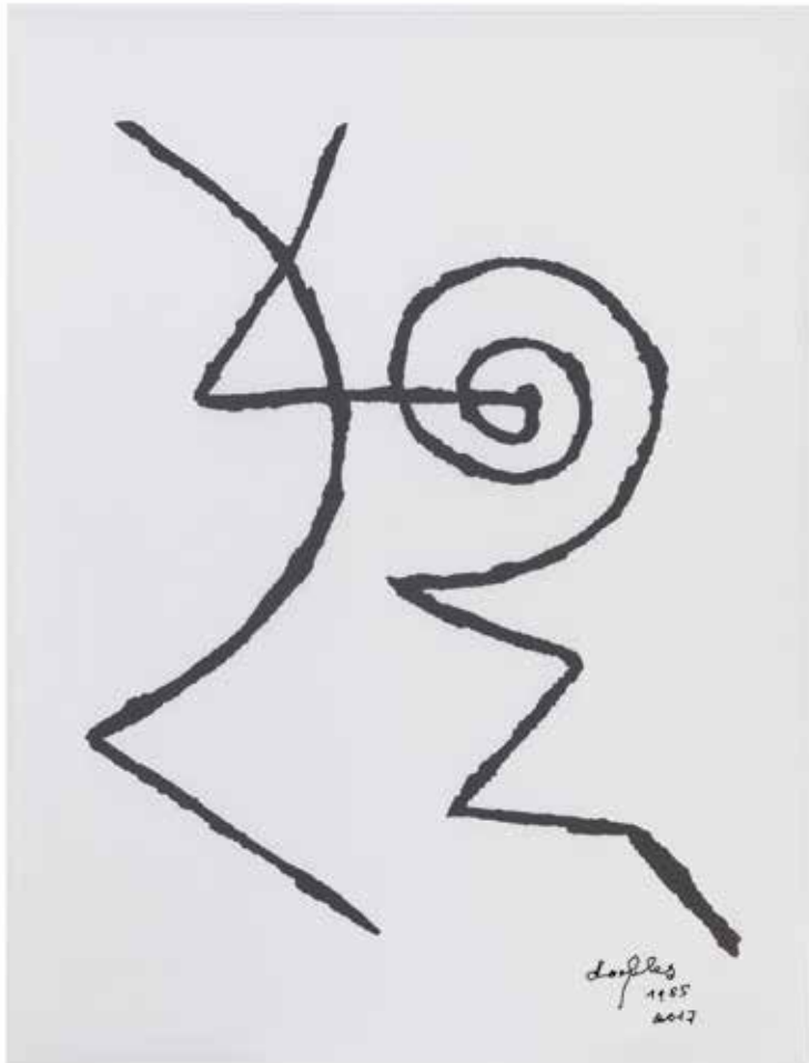
Senza titolo, 1955-2017 Pannello fonoassorbente Snowsound, parete, 159 x 119 cm

Untitled, 1955-2017 Sound-absorbing Snowsound panel, wall, 159 x 119 cm