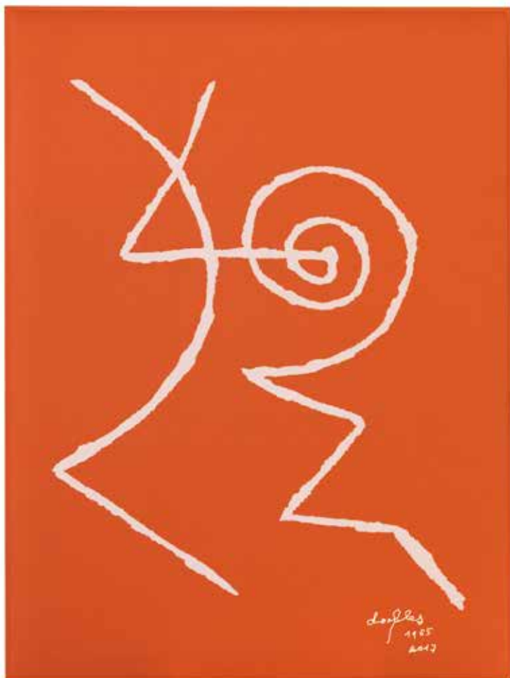
Senza titolo, 1955-2017 Pannello fonoassorbente Snowsound, parete, 159 x 119 cm

Untitled, 1955-2017 Sound-absorbing Snowsound panel, wall, 159 x 119 cm